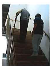
日常生活動作指導