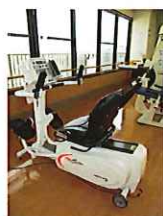
自主性を重んじたリハビリメニュー