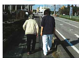
屋外歩行練習可能