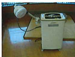
マイクロ波(温熱療法)