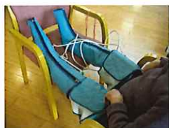
メドマー(浮腫除去)