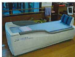
ウォーターベッド