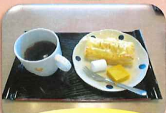
木 パンプキンパイ