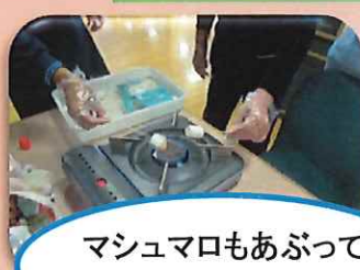
マシュマロもあぶって食べると美味しいよ！