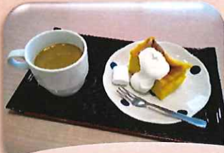
金 パンプキンチーズスフレ